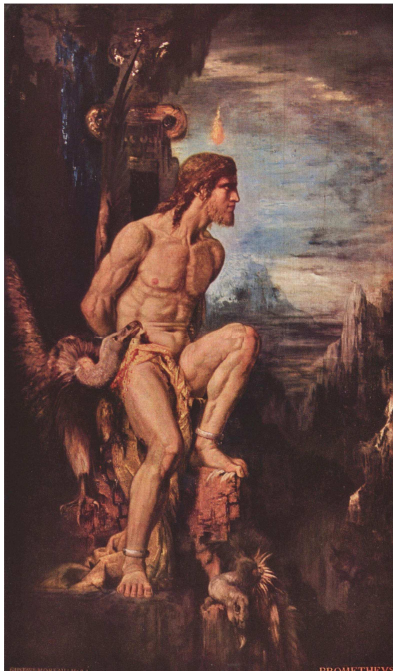
Prometheus by Gustave Moreau, (1868).